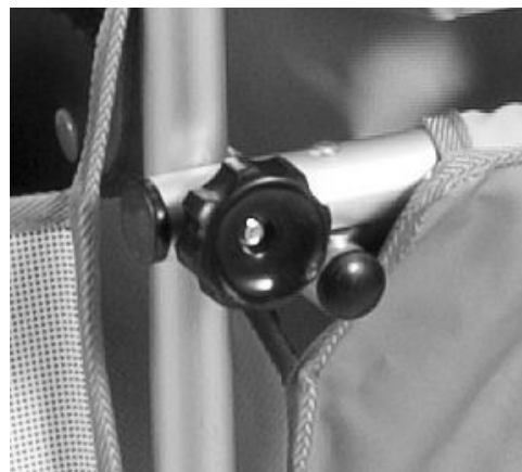
4シート、6シートタイプ